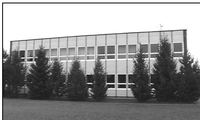
Nová okna v ZŠ.