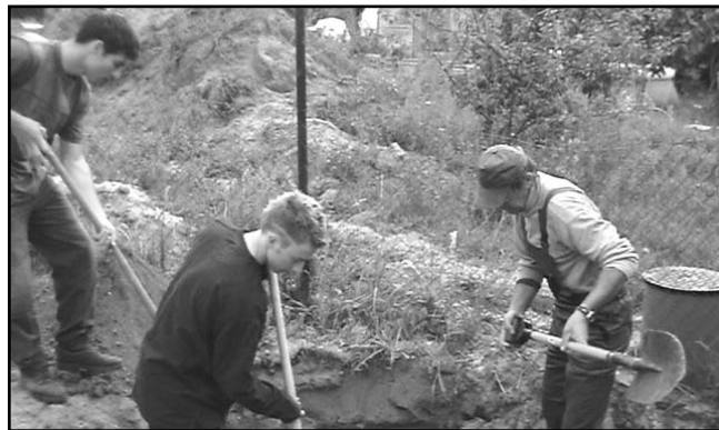
Výkopové práce na Cikánce.