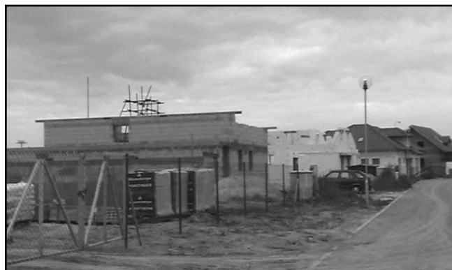
V lokalitě Na Křenovce vyrůstá nových 39 rodinných domků.