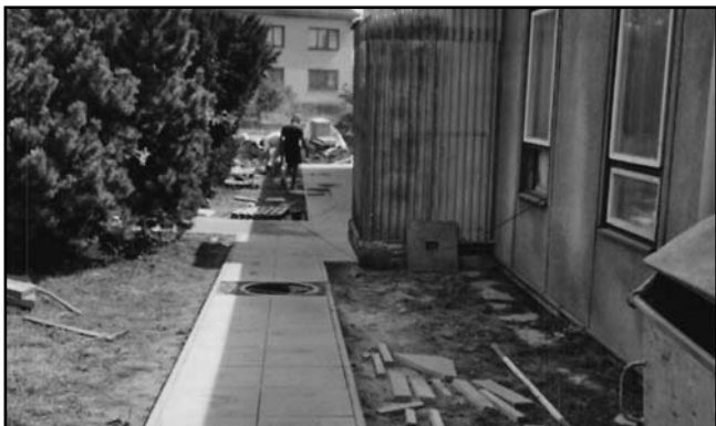
O prázdninách provedla firma Pavelka rekonstrukci chodníku u bývalého prvního pavilonu MŠ.