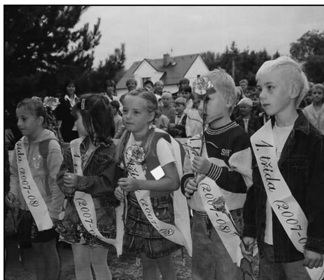
Prvněáčkové dostali na uvítanou šerpy. foto: M. Dvořáková