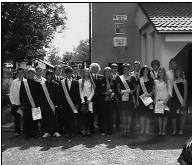
26.6. - loučení s 9. třídou na obecním úřadě