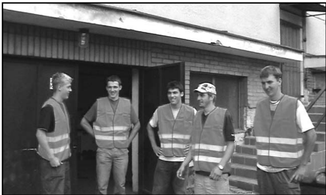
O letošních prázdninách pracovalo v obci několik brigádníků z řad studentů.