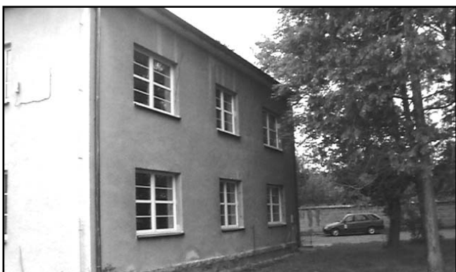
Během prázdnin provedla firma výměnu oken na obecním úřadě.