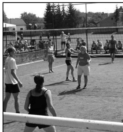
Volejbalový zápas při posvícenském turnaji.