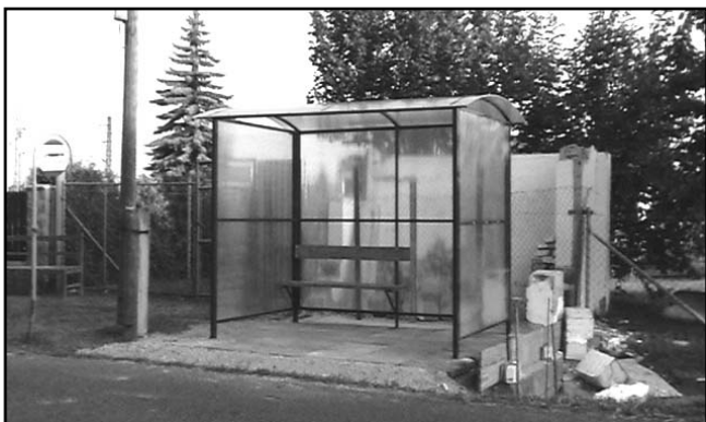
Nová autobusová čekárna v Hronětické ulici. Postupně bychom chtěli vyměnit i ostatní autobusové čekárny.