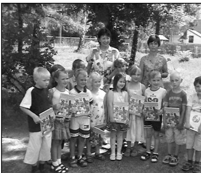
12.6. - loučení s MŠ na obecním úřadě.