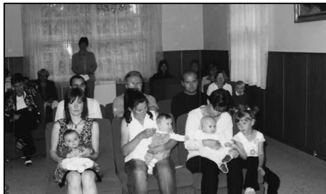
27. 6. proběhlo zatím poslední vítání občánků.